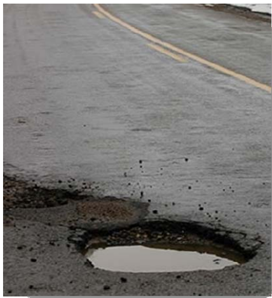
POT HOLE ( ۱ )