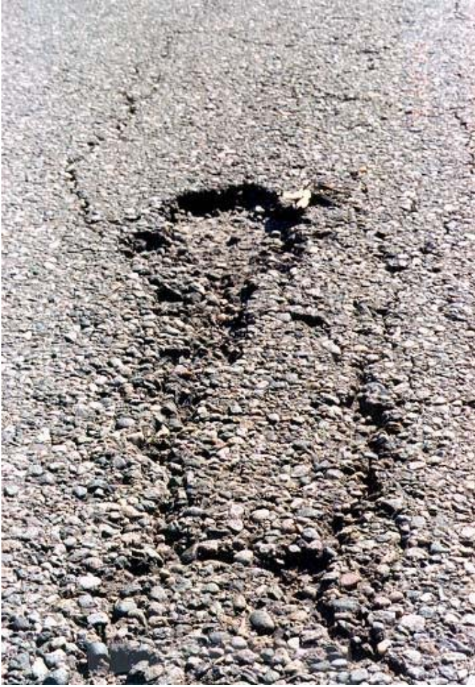
RAVELING ( 2 )